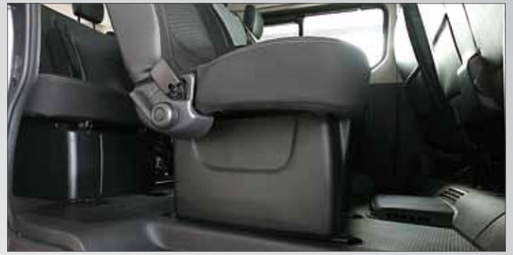
Rivestimenti laterali e anteriori delle gambe dei sedili di seconda e terza fila.