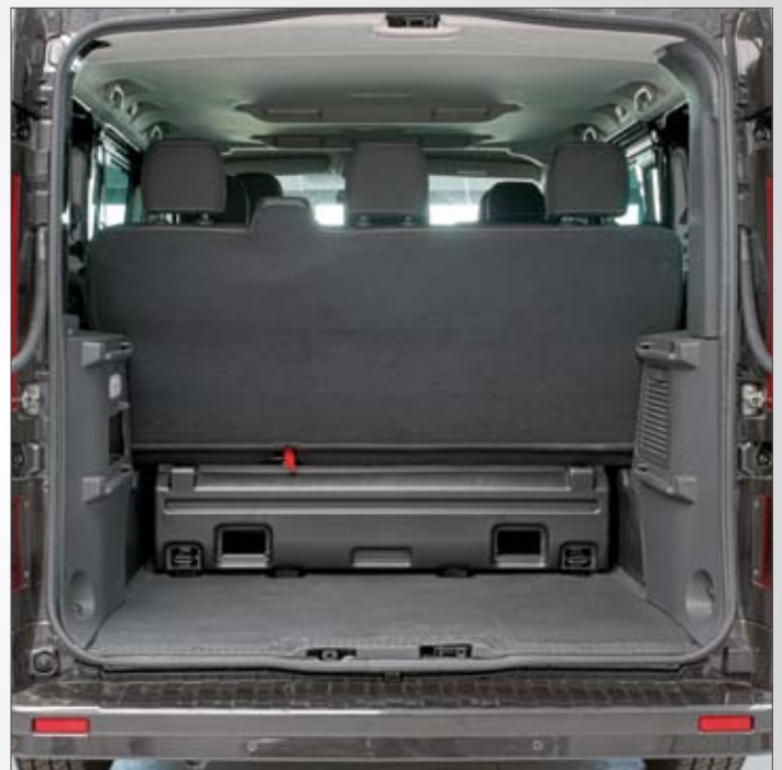
Rivestimenti delle panchette originali di seconda e terza fila nella versione base 9 posti viaggio.

OMOLOGAZIONI L'ufficio omologazioni di Focaccia Group è in contatto diretto con i maggiori Costruttori e dialoga con il Ministero dei Trasporti, garantendo il pieno rispetto delle normative ed i canoni costruttivi di sicurezza della Casa Madre anche nei collaudi in unico esemplare.