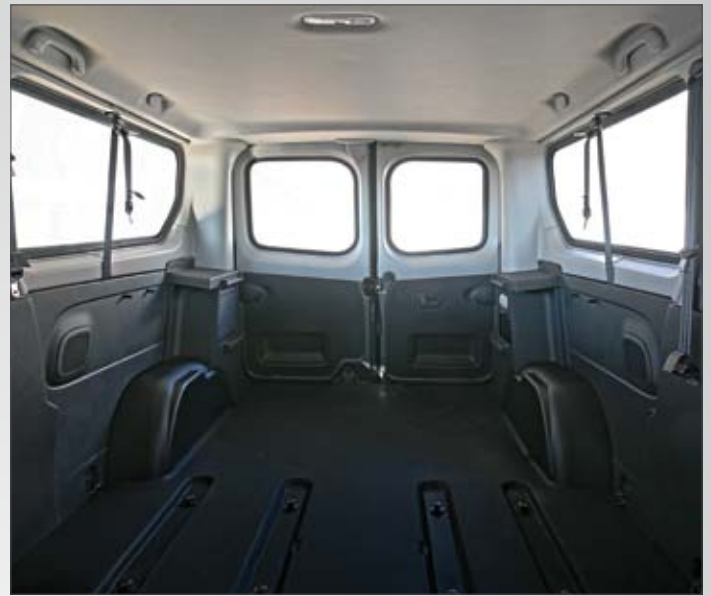
Kit rivestimenti in ABS termoformato per passaruota, cornici finestrini e porta posteriore (a battente o basculante).