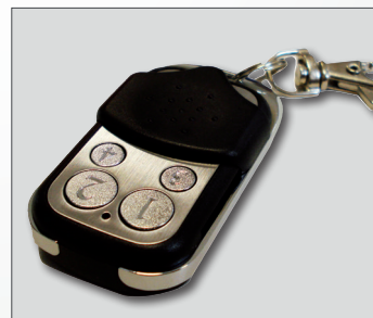
Radiocomando wireless di serie per la movimentazione a distanza.

Progettato specificatamente per le persone, il sollevatore Fiorella garantisce massima affidabilità e sicurezza , sia durante la fase di sollevamento che durante il trasporto. Il suo stile moderno e raffinato si integra alla perfezione con gli interni di Multivan.