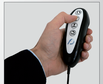
F-Wired Comando a filo disponibile in optional.