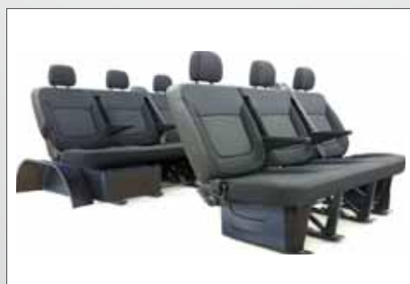
Rivestimenti laterali e anteriori delle gambe dei sedili di seconda e terza fila.