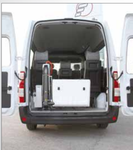
Sollevatore Fiorella Slim Fit F360