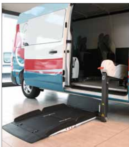
Sollevatore Fiorella Slim Fit F360 EX