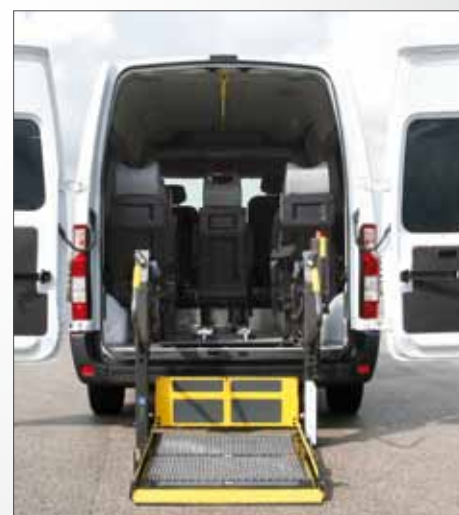
Sollevatore Doppio Braccio

Renault Master può essere allestito per trasporto persone con disabilità con sollevatore Fiorella Slim Fit nelle versioni F360 (la versione standard con piattaforma di dimensioni 1030x714 mm) e F360 EX (la versione Extended con piattaforma di dimensioni 1075x765 mm, più grande e adatta anche al trasporto delle carrozzine più ingombranti). Entrambe le versioni del sollevatore Fiorella Slim Fit possono essere installate anche sul vano d'ingresso laterale di Renault Master.