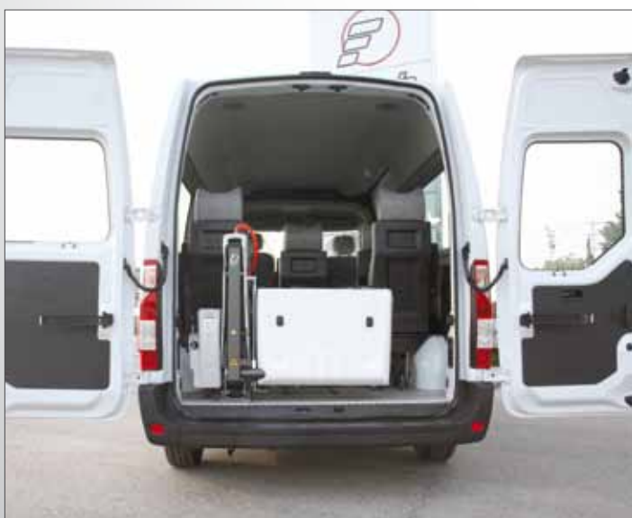
Fiorella Slim Fit F360