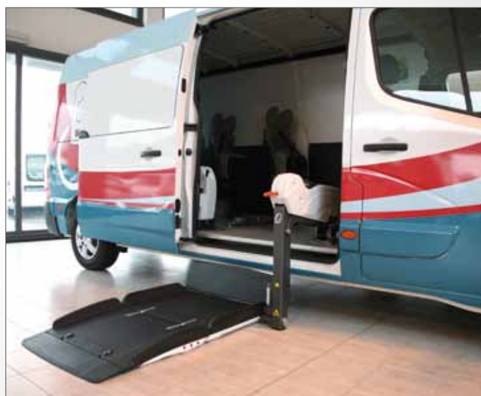
Fiorella Slim Fit F360EX

Renault Master for the transportation of people in wheelchair can be equipped with Fiorella Slim Fit F360 (the Standard version with a platform size of 1030x714 mm) and F360EX (the Extended version with wider platform of 1075x765 mm, suitable for bulky electric wheelchairs or scooters). Fiorella Slim Fit, in both the versions, can be installed even on the side door of Renault Master.